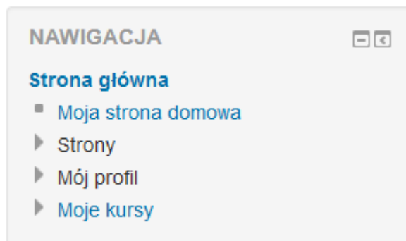
Rysunek 5. Blok nawigacji

Po lewej stronie niżej znajduje się blok administracji. Za jego pomocą można dokonywać edycji ustawień profilu, danego kursu lub danej aktywności (rysunek 6)